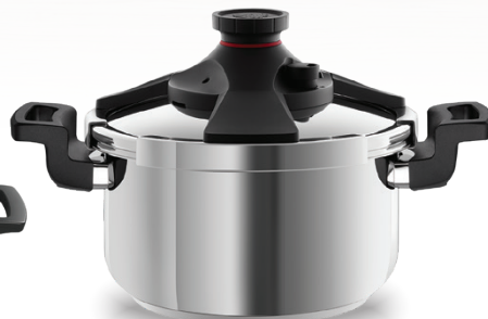
Royal Prestige® Pressure Cooker