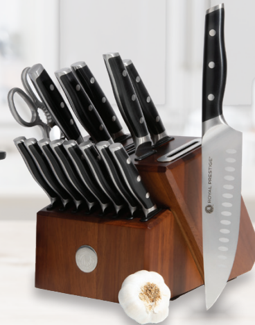
Royal Prestige® All-In-One Knife block