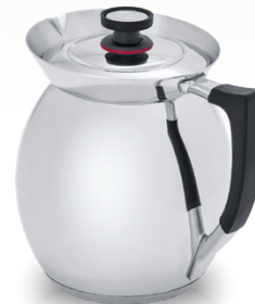
Royal Prestige® Chocolatera