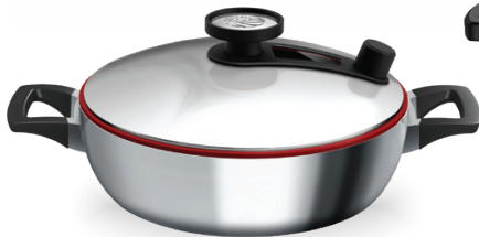
Royal Prestige® INNOVE™ Paella Pan