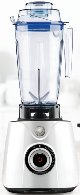
Royal Prestige® Power Blender