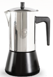
Royal Prestige® Espresso