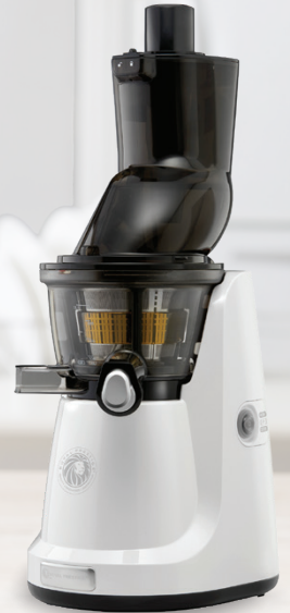
Royal Prestige® Juicer