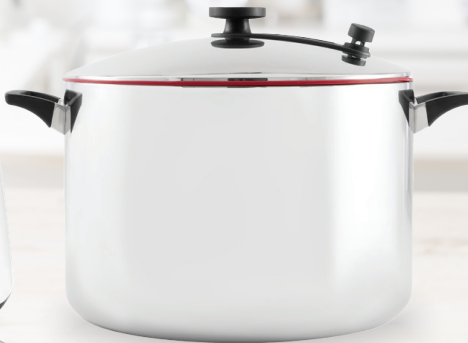
Royal Prestige® Stock Pot